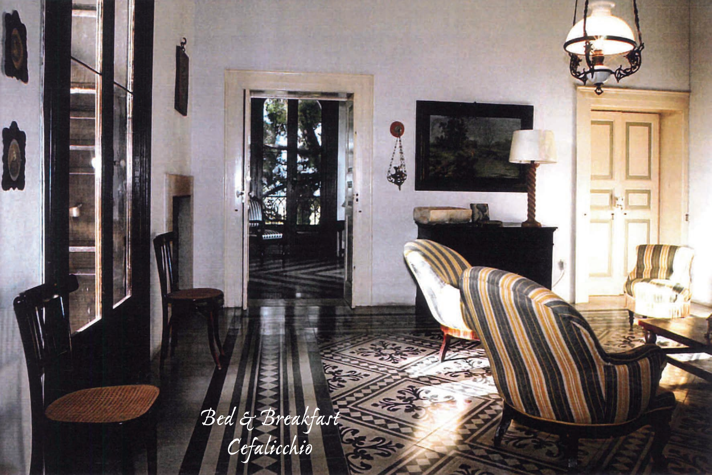
Bed & Breakfast Cefalicchio